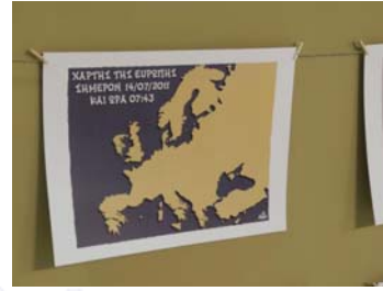
6. Hantzopoulos (2011)