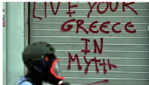
10. Pintada "Live your greece in myth" (Atenas)