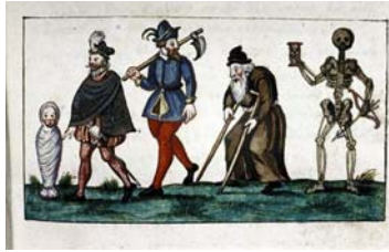
4. Edades del Hombre. Tratado Alquímico XVII

que produce cambios continuos, “envejecimientos” en el tiempo, y que por ello se articula en torno a las edades del tiempo, edades del mundo, entendidas como edades del Sujeto de la Historia [4].