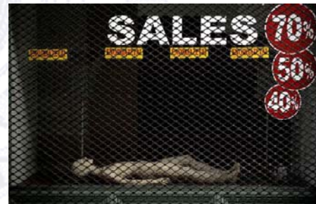
19. Cierre de locales (Atenas)