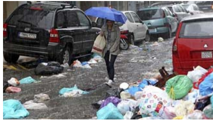
16. Huelga basura Atenas 2012

putrefacción de la carne, bien, como es el caso, por funcionamiento anómalo de los órganos encargados de la eliminación de tales elementos.