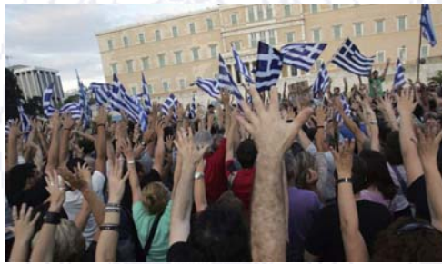
11. Plaza Sintagma (Atenas)

La piel de la ciudad se cubre de tatuajes, como forma de exteriorización en la carne de la mortificación interna que padecen sus ciudadanos. Cuerpo pues, que narra su historia. Cuerpo que testimonia la evolución y devenir del sujeto, de su historia con elementos de gran significación. El cuerpo tatuado “habla de las memorias y proyectos del sujeto: de sus dichas, desdichas, ansias, temores, ideales, lealtades, ideologías, convicciones y luchas” 35 . Si la identidad del sujeto utiliza su cuerpo como medio de subjetivación, la ciudad como tal forma parte a su vez de este proceso, de la afirmación y de la construcción de la identidad de sus moradores como pueblo. De hecho, si el dolor individúa y se dirige hacia lo más interno y personal de uno mismo, hacia lo más propio, las exteriorizaciones del malestar y del dolor de la ciudadanía o de un grupo suelen estar ligadas a la afirmación de aquello que los une, que no es el dolor, sino una identidad común. Recuérdese el mar azul y blanco de banderas ondeantes en la plaza Sintagma de Atenas [11]. El peligro es, en este caso, la exaltación nacionalista (justificada o no), que hace que en momentos de crisis los hombres busquen la protección de aquello que les permita eliminar su dolor (como en el caso de la estrecha victoria de Hitler tras las elecciones de 1933, en un clima, también de crisis económica y escasez).