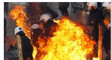
15. Altercados Atenas