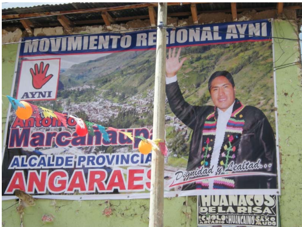
CANDIDATO COMUNERO, LIRCAY 2014