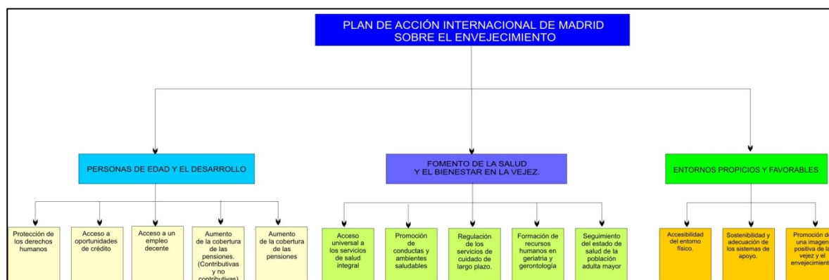
Figura No. 1: Plan de Acción Internacional de Madrid sobre el Envejecimiento.

A. Plan de Acción Internacional de Madrid sobre el Envejecimiento. Orientación Prioritaria I. Personas de Edad y el Desarrollo: El AM debe tener un envejecimiento activo (EA) en donde él se beneficie del desarrollo del país. Para ello se garantizará el principio de equidad entre las generaciones, mediante la justa distribución equitativa de los beneficios del crecimiento económico. Orientación Prioritaria II. Salud y Bienestar en la Vejez: El AM debe contar con atención en salud preventiva, curativa, rehabilitación y servicios de salud sexual. Envejecer con buena salud es un proceso personal y requiere del cuidado que el individuo tenga de su cuerpo y que cuente con un entorno que garantice con éxito su pleno desarrollo. Orientación Prioritaria III. Entornos Propicios y Favorables: Entorno propicio, este concepto emana de la Cumbre Mundial sobre el Desarrollo Social en Copenhague (1995) y se interpreta en el marco de condiciones económicas y políticas favorables para el desarrollo social. Al Plan de Acción se incorpora el concepto de las estructuras de redes familiares y comunitarias que prestan asistencia al AM.