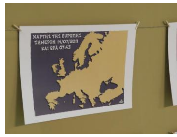
6. Hantzopoulos (2011)

Entre los síntomas físicos de una enfermedad encontramos el dolor intangible, visible sólo a través de sus efectos; así como otros síntomas como la inflamación, los vómitos, la supuración, la incapacidad de emplear normalmente algunos órganos o partes del cuerpo. Tanto Atenas como Madrid han presentado estos síntomas a través de su lenguaje urbano. Es hora de la clínica, del reconocimiento de los síntomas. En Crítica y clínica Deleuze sostiene que ante la enfermedad es preciso, incluso en opinión de Freud, confeccionar un mapa, un medio que “se compone de cualidades, de sustancias, de fuerzas y acontecimientos: por ejemplo la calle, y sus materiales como los adoquines, sus ruidos como las voces de los vendedores, sus animales como los caballos atados a los carros, sus dramas [...] El trayecto no sólo se confunde con la subjetividad de quienes recorren el medio, sino con la subjetividad del medio en sí en tanto que éste se refleja en quienes lo recorren. El mapa expresa la identidad del itinerario y de lo recorrido” 32 . En la calle, en los adoquines, en las voces y ruidos, en los muros, en las plazas y en los modos y maneras de las aglomeraciones se han ido mostrando diferentes síntomas. En época de crisis el cuerpo de la polis sufre, como dijera Hipócrates, un desequilibrio interno, que hace que el régimen ya no sea estable y su pervivencia se ponga en peligro de muerte. De nuevo, la Política de