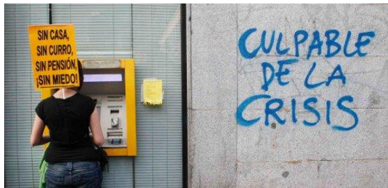
8. Pintada “Culpable de la crisis” (Madrid)