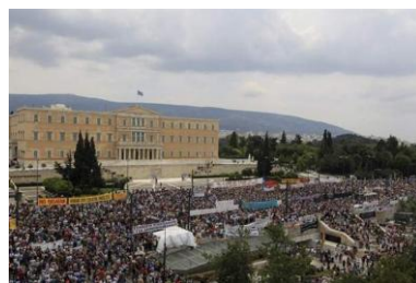
14. Plaza Sintagma (Atenas)