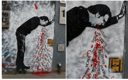
12. Graffiti (Londres)