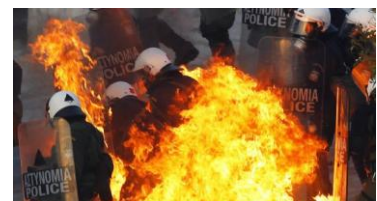
15. Altercados Atenas