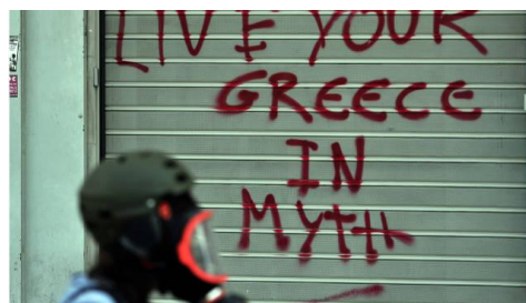
10. Pintada “Live your greece in myth” (Atenas)