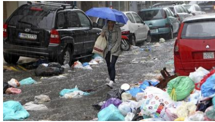
16. Huelga basura Atenas 2012

[16 y 17] Tanto en Atenas como en Grecia los recortes, la amenaza del paro, la suspensión de pagos han tenido otro efecto: la supuración a través de los desechos y el hedor de las calles, provocados por las huelgas de basura. Ambos efectos suelen ir ligados a la idea de la falta de vida, bien por putrefacción de la carne, bien, como es el caso, por funcionamiento anómalo de los órganos encargados de la eliminación de tales elementos.