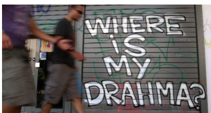
9. Pintada “Where ist my drahma?” (Atenas)