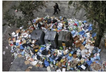
17. Huelga basura Madrid 2013