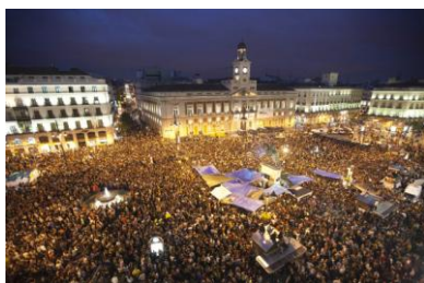
13. Puerta del Sol (Madrid)

Otro síntoma que experimenta el cuerpo de la ciudad ante la enfermedad es la inflamación o hinchazón, entendida, patológicamente como una “alteración en una parte cualquiera del organismo, caracterizada por trastornos de la circulación de la sangre y, frecuentemente, por aumento de calor, enrojecimiento, hinchazón”. La inflamación de la ciudad, el colapso de sus calles, la ocupación de sus plazas, se produce a través no de modificaciones o cambios en la carne, sino en la aglomeración intensa de elementos que forman parte del cuerpo de la ciudad [13 y 14]: lo que da vida a la misma, su sangre, sus ciudadanos (no es preciso señalar la relación que desde la Antigüedad han tenido la vida y la sangre, relación, por cierto, que ha pasado a la mitología popular a través de la figura del vampiro). Las plazas, las grandes arterias de la ciudad se convierten en el lugar manifestación de inflamación, que llega incluso a un aumento del calor y de los ánimos [15]. De ahí, por cierto, la importancia del diseño de la ciudad que no se reduce a la funcionalidad de las estructuras urbanísticas, sino que interviene directamente en el espacio en el que vivimos y que condiciona nuestra forma de habitar y de relacionarnos con los otros. Como cirujía preventiva, Haussmann, por ejemplo, en su planificación urbana de París, lo que trató es de eliminar la posibilidad de manifestación del síntoma, esto es, evitar los amotinamientos y luchar contra las barricadas revolucionarias 36 .