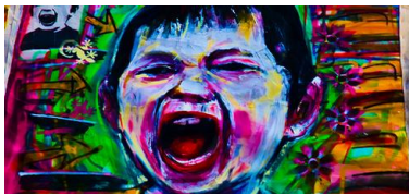
7. Graffiti grito (Madrid)

El primero de estos síntomas ha sido el dolor. Dolor ante la falta de trabajo, dolor ante el desahucio, dolor ante el miedo, dolor ante la falta de expectativas, dolor ante los remedios aplicados por la psique del gobernante. Pero del dolor que en verdad se siente, recordando los versos de Pessoa, sólo puede dar cuenta quien lo padece no manifestando el dolor mismo, por la imposibilidad de expresar lo más propio, sino su imagen o expresión. Ante el dolor que se siente en propia carne sólo caben dos salidas: o el silencio o el grito. Decidirse por el grito se refleja en la carne ( sarx ) de la ciudad a través de graffitis [7], de mensajes de queja escritos en las paredes [8, 9] e incluso expresiones de desesperanza [10].