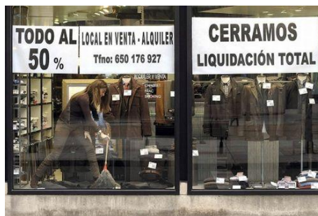
18. Cierre de locales (Madrid)

Pero el funcionamiento anómalo, o la incapacidad de algunos órganos o partes del mismo de ofrecer sus servicios es, también, parte de los síntomas. La ciudad queda inmovilizada y los intercambios entre sus habitantes reducidos al mínimo. Es el caso, por ejemplo, de la quiebra de empresas y del cierre de establecimientos comerciales. [18] Si la sangre son los ciudadanos, aquello que la oxigena y la bombea, es, precisamente lo primero que sufre en una crisis: el motor (el dinero en el caso económico, lo emocional en el caso personal, la ideas en una crisis creativa). Y este mal funcionamiento lleva a la inmovilidad [19].