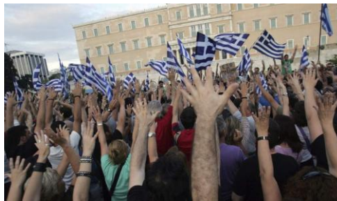
11. Plaza Sintagma (Atenas)

La piel de la ciudad se cubre de tatuajes, como forma de exteriorización en la carne de la mortificación interna que padecen sus ciudadanos. Cuerpo pues, que narra su historia. Cuerpo que testimonia la evolución y devenir del sujeto, de su historia con elementos de gran significación. El cuerpo tatuado “habla de las memorias y proyectos del sujeto: de sus dichas, desdichas, ansias, temores, ideales, lealtades, ideologías, convicciones y luchas” 35 . Si la identidad del sujeto utiliza su cuerpo como medio de subjetivación, la ciudad como tal forma parte a su vez de este proceso, de la afirmación y de la construcción de la identidad de sus moradores como pueblo. De hecho, si el dolor individúa y se dirige hacia lo más interno y personal de uno mismo, hacia lo más propio, las exteriorizaciones del malestar y del dolor de la ciudadanía o de un grupo suelen estar ligadas a la afirmación de aquello que los une, que no es el dolor, sino una identidad común. Recuérdese el mar azul y blanco de banderas ondeantes en la plaza Sintagma de Atenas [11]. El peligro es, en este caso, la exaltación nacionalista (justificada o no), que hace que en momentos de crisis los hombres busquen la protección de aquello que les permita eliminar su dolor (como en el caso de la estrecha victoria de Hitler tras las elecciones de 1933, en un clima, también de crisis económica y escasez).