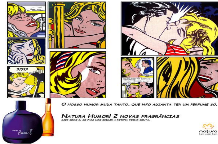
Figura 5. Natura Humor. Disponível: http://www.designup.pro.br/files/port/1240979878.jpg Acesso em 26 de janeiro de 2013.

Em síntese, podemos perceber que apropriação de determinado estilo artístico ou obra de arte tem sido um recurso estratégico bastante utilizado pela publicidade. A apropriação das referências artísticas pode ser verificada em todo tipo de anúncio publicitário, desde veneno para matar ratos até perfumes, desde que seja adequado aos objetivos comunicacionais das empresas.