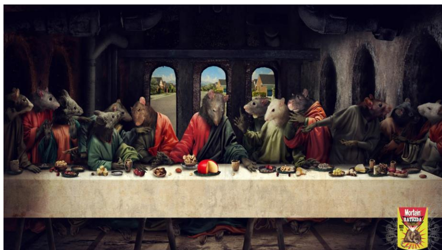
Figura 3. A Última Ceia. Disponível em: < http://artenapp.blogspot.com.br/ >. Acesso: 26 de janeiro de 2013.

No anúncio, os matam ratos “Mortein” utilizaram do drama, teatralidade e excitação da obra de Leonardo da Vinci para formular um argumento altamente persuasivo sobre a eficiência do seu veneno. A peça retrata de forma irônica e dramática o que seria a última ceia dos roedores, associado a obra de Da Vinci “A Última Ceia”. A estratégia era chamar atenção do consumidor para a eficácia do produto que tem o foco na exterminação de ratos de modo não chocar o consumidor.