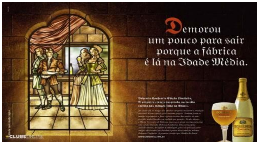
Figura 2. Bohemia. Disponível em: < http://www.putasacada.com.br/wp-content/uploads/2012/02/bohemia.jpg > . Acesso em 26 de janeiro de 2013.

No anúncio, os matam ratos “Mortein” utilizaram do drama, teatralidade e excitação da obra de Leonardo da Vinci para formular um argumento altamente persuasivo sobre a eficiência do seu veneno. A peça retrata de forma irônica e dramática o que seria a última ceia dos roedores, associado a obra de Da Vinci “A Última Ceia”. A estratégia era chamar atenção do consumidor para a eficácia do produto que tem o foco na exterminação de ratos de modo não chocar o consumidor.