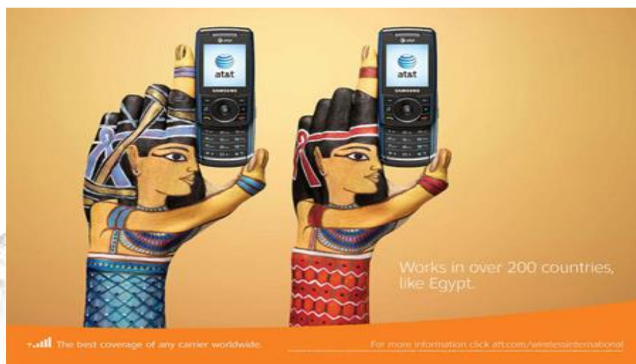
Figura 1: Egito. Disponível em:

culturalmente reconhecida em todo mundo, e o objetivo da empresa é a de demonstrar que a sua cobertura telefônica se estabelece em mais de duzentos países; incluindo o Egito.